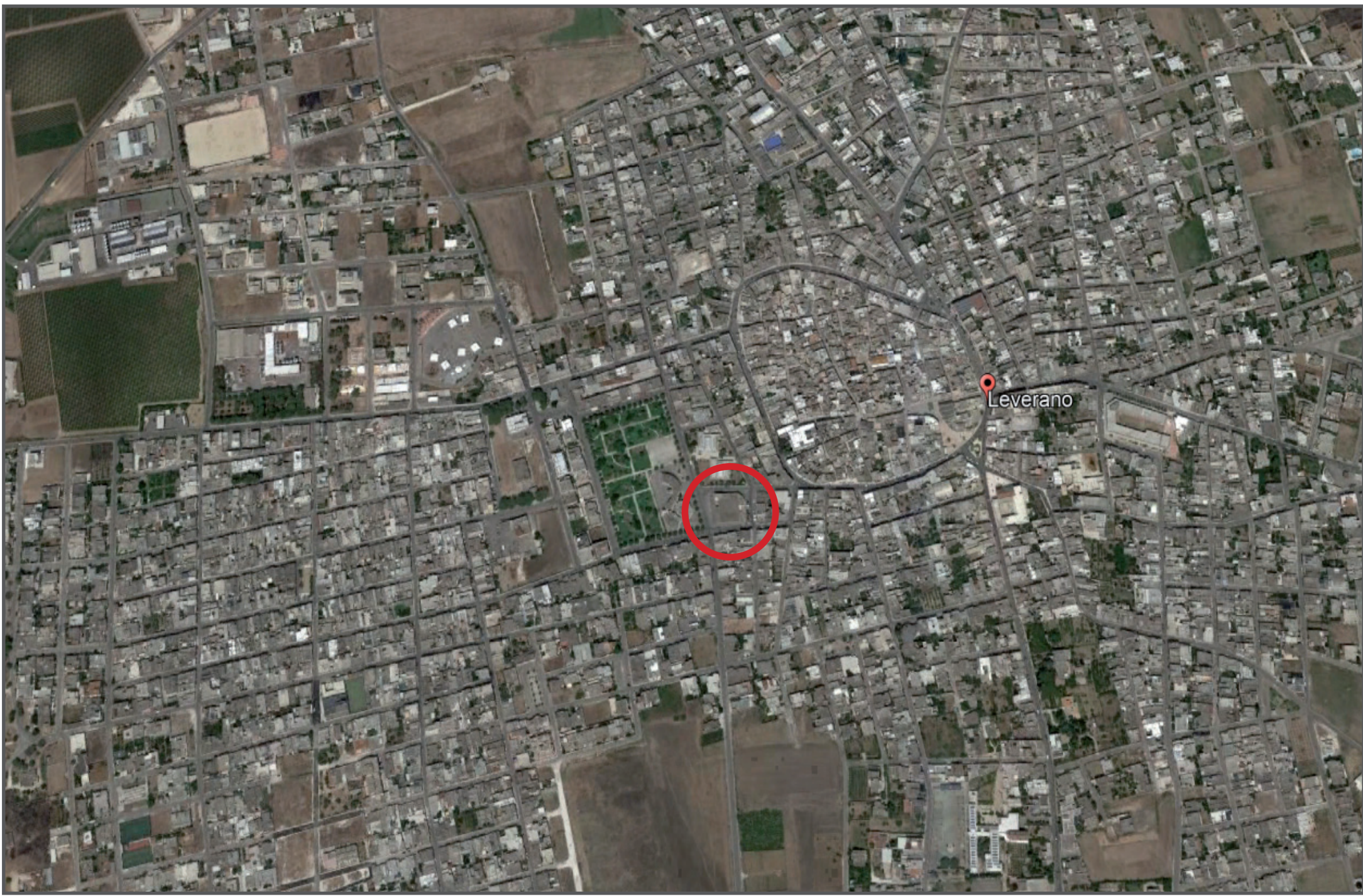
ortofoto: localizzazione dell'intervento