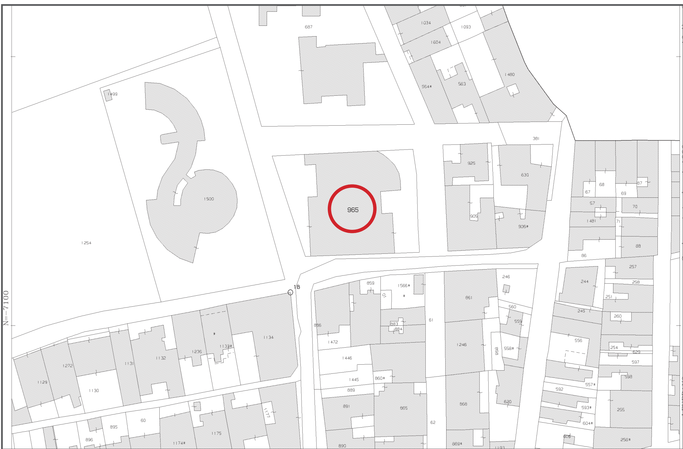
stralcio catastrale: foglio 30 particella 965